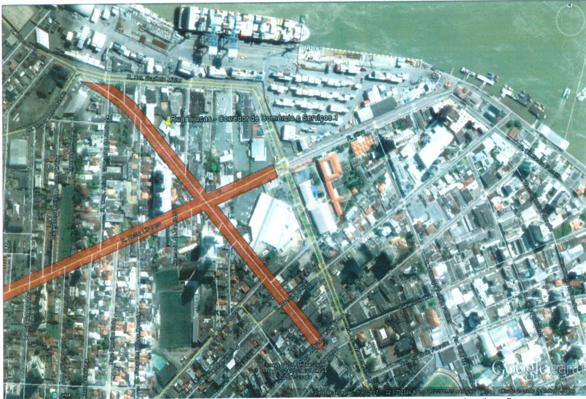
Figura 03. Mapa de localização, da Rua Tijucas, onde está prevista a reurbanização.