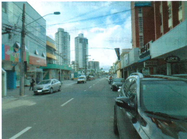
Fig 01- Imagem da Rua Tijucas em sua condição atual. Nesta intervenção projetada está previsto alargamento e melhoria nos passeios, criação de canteiros e arborização nestes espaços, instalação de mobiliários urbanos e melhoria do sistema de drenagem pluvial.