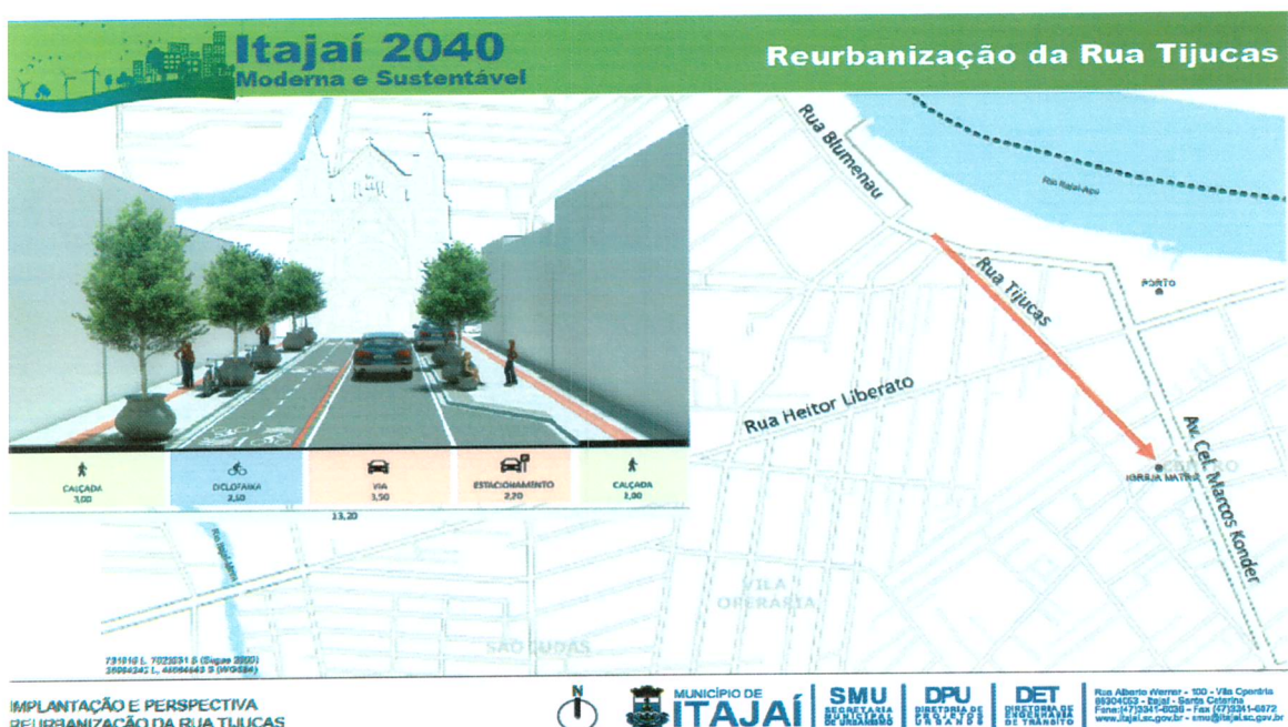
Fig 04- Imagem da reurbanização da Rua Tijucas, com ilustração de como será a implantação.